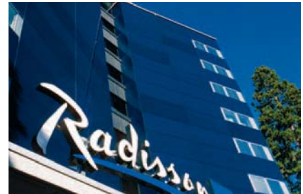
****Hotel Radisson SAS St.Jakob-Strasse 55, 9000 St.Gallen Tel. 071 242 12 12 www.stgallen.radissonsas.com