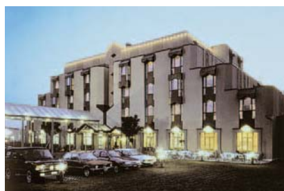
****Hotel Säntispark, Abtwil Wiesenbachstrasse 5, 9030 Abtwil Tel. 071 313 11 11 www.saentispark.ch