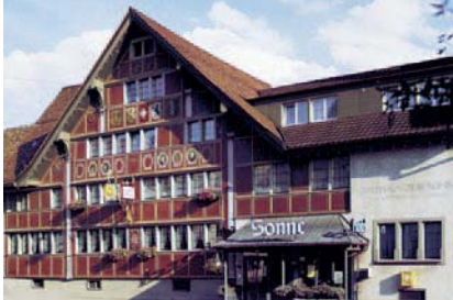
Landgasthof Sonne, Gossau St.Galler Strasse 22, 9200 Gossau Tel. 071 385 16 51 (einfaches Hotel)

Hotels ausserhalb von Gossau in wenigen Minuten per Auto/Taxi erreichbar. Auch mit öffentlichen Verkehrsmitteln.