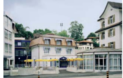
***Hotel Herisau, Herisau Bahnhofstrasse 14, 9100 Herisau Tel. 071 354 83 83 www.hotelherisau.ch