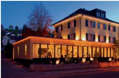
Hotel Landhaus Säntis, Herisau Garni-Hotel Säntis, Herisau Kasernenstrasse 29 und 44 9100 Herisau Tel. 071 353 01 00 www.hotel-saentis-herisau.ch