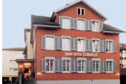
Hotel Zum alten Bahnhof, Gossau Herisauer Strasse 32, 9200 Gossau Tel. 071 388 69 70 www.hotelgossau.ch (einfaches Hotel)