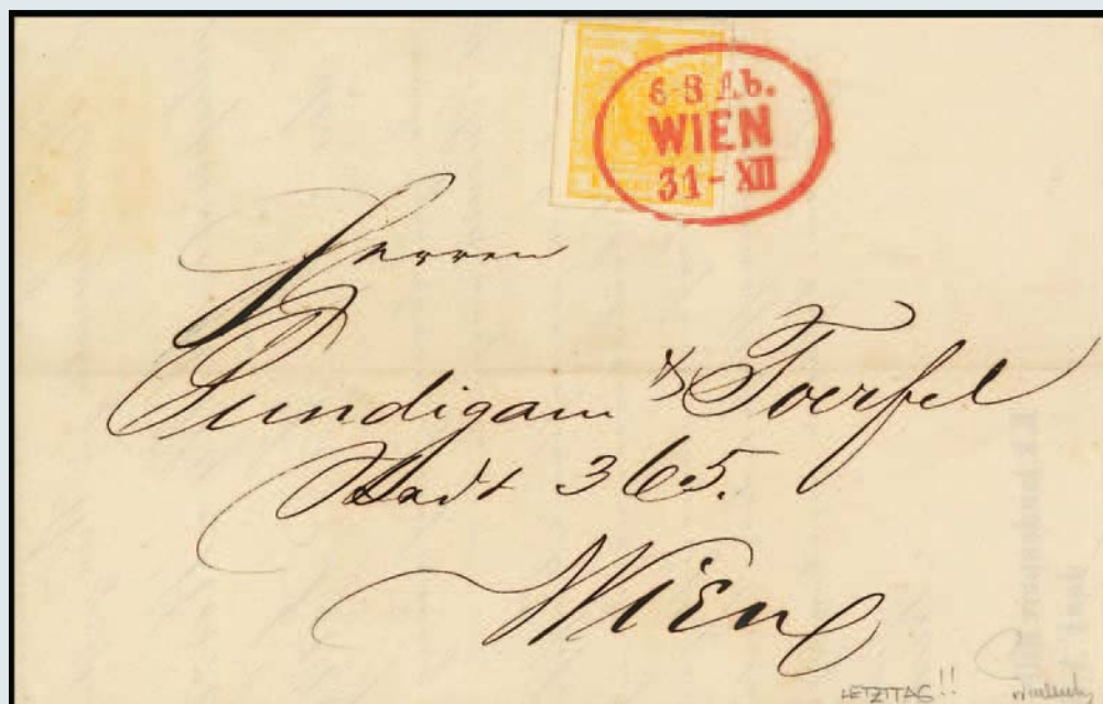
Österreich: Letzttagbrief der 1. Ausgabe