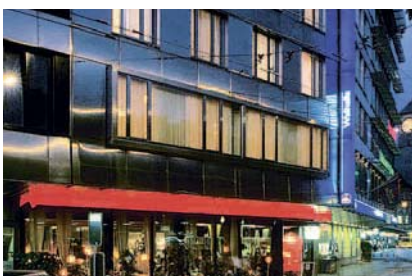
****Hotel Walhalla, St.Gallen Bahnhofplatz, 9000 St.Gallen Tel. 071 228 28 00 www.hotelwalhalla.ch