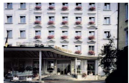
****Hotel Einstein, St.Gallen Berneggstrasse 2, 9000 St.Gallen Tel. 071 227 55 55 www.einstein.ch