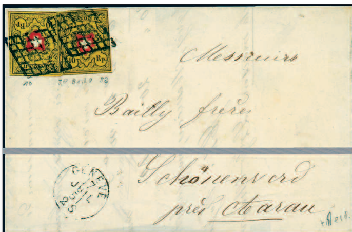
Dieser Brief ist möglicherweise ein Unikat, da Rayon-II-Marken vom Druckstein B1 nicht an die Post in Genf geliefert wurden. Dennoch ging der Brief mit den kehldruckartig geklebten Einzelmarken in Genf auf die Reise.

Auf diese Weise hat im Prinzip jeder Philatelist einmal angefangen. Der eine blieb der Normalsammlung treu und erfreut sich im Stillen kompletter Jahrgänge, ganz gleich ob mit oder ohne Unternehmern. Der andere spezialisierte sich auf eine Ausgabe oder eine Epoche und gewann Medaillen auf nationalen oder gar internationalen Ausstellungen. Ohne die Liebe zu den kleinen Druckwerken gäbe es aber keine Philatelie. Daran hat sich seit den Tagen Carl Franz Ballys nichts geändert. tb