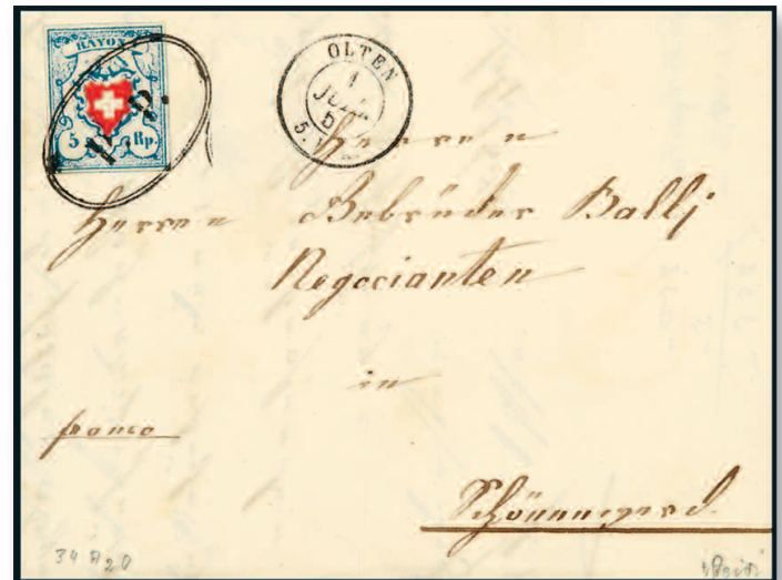
Der Ellipsenstempel mit Inschrift „P.P.“ aus Olten entwertete die breitrandige Rayon I, Type 34 A2 / O.

Über 150 Jahre schlumerten die Belege in Familienbesitz, wurden von Generation zu Generation weitergereicht. Nunmehr lieferten die Erben die archivfrischen Dokumente beim Gossauer Auktionator Chiani ein. Das ohnehin schon philatelistisch hochwertige Jahr ist damit um eine Attraktion reicher, ja, man kann mit Fug und Recht von einer Sensation sprechen. Auf 50 Lose verteilt Chiani die zwischen 1850 und 1870 entstandenen