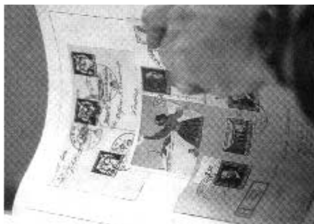
Wer sucht, wird fündig: Entweder beim Durchforsten der Kartonschachteln oder in den kostbaren Sammleralben.