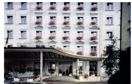
****Hotel Einstein, St.Gallen Berneggstrasse 2, 9000 St.Gallen Tel. 071 227 55 55 www.einstein.ch