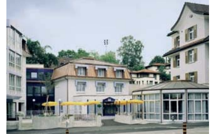
***Hotel Herisau, Herisau Bahnhofstrasse 14, 9100 Herisau Tel. 071 354 83 83 www.hotelherisau.ch