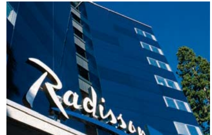
****Hotel Radisson SAS St.Jakob-Strasse 55, 9000 St.Gallen Tel. 071 242 12 12 www.stgallen.radissonsas.com