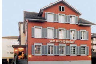
Hotel Zum alten Bahnhof, Gossau Herisauer Strasse 32, 9200 Gossau Tel. 071 388 69 70 www.hotelgossau.ch (einfaches Hotel)