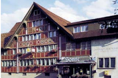
Landgasthof Sonne, Gossau St.Galler Strasse 22, 9200 Gossau Tel. 071 385 16 51 (einfaches Hotel)

Hotels ausserhalb von Gossau in wenigen Minuten per Auto/Taxi erreichbar. Auch mit öffentlichen Verkehrsmitteln.