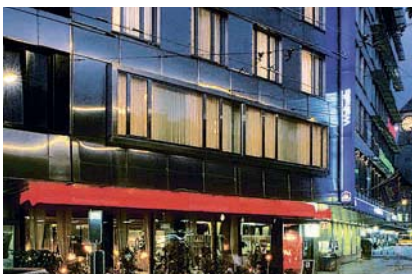
****Hotel Walhalla, St.Gallen Bahnhofplatz, 9000 St.Gallen Tel. 071 228 28 00 www.hotelwalhalla.ch