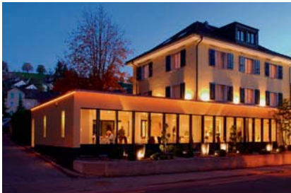
Hotel Landhaus Säntis, Herisau Garni-Hotel Säntis, Herisau Kasernenstrasse 29 und 44 9100 Herisau Tel. 071 353 01 00 www.hotel-saentis-herisau.ch