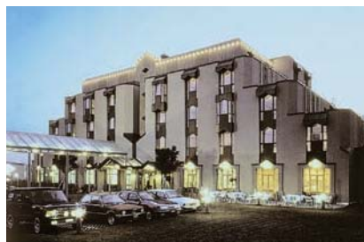
****Hotel Säntispark, Abtwil Wiesenbachstrasse 5, 9030 Abtwil Tel. 071 313 11 11 www.saentispark.ch