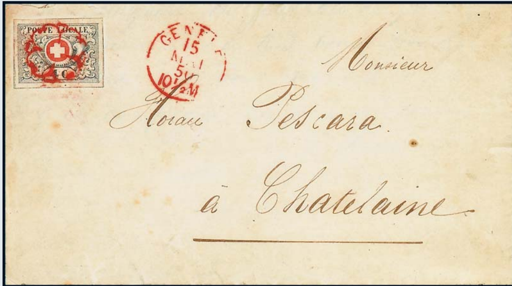
Waadt 4 C. auf vollständigem Luxus-Brief nach Chatelaine.