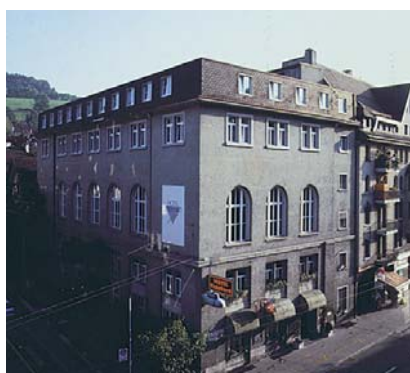
***Hotel Ekkehard, St.Gallen Rorschacher Strasse 50, 9000 St.Gallen Tel. 071 224 04 44