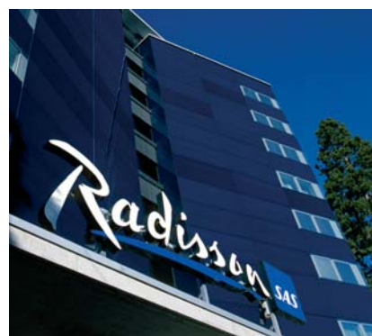
****Hotel Radisson SAS St.Jakob-Strasse 55, 9000 St.Gallen Tel. 071 242 12 12