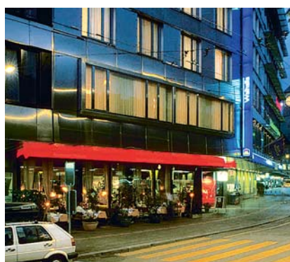
****Hotel Walhalla, St.Gallen Bahnhofplatz, 9000 St.Gallen Tel. 071 228 28 00