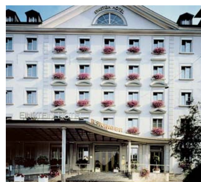
****Hotel Einstein, St.Gallen Berneggstrasse 2, 9000 St.Gallen Tel. 071 227 55 55