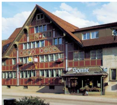
Landgasthof Sonne, Gossau St.Galler Strasse 22, 9200 Gossau Tel. 071 385 16 51

Hotels ausserhalb von Gossau in wenigen Minuten per Auto/Taxi erreichbar. Auch mit öffentlichen Verkehrsmitteln.