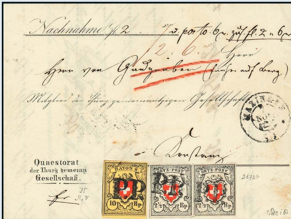
Einzig bekannte Nachnahme-Mischfrankatur ins Ausland.