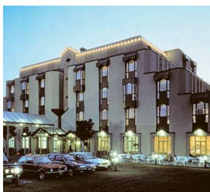
****Hotel Säntispark, Abtwil Wiesenbachstrasse 5, 9030 Abtwil Tel. 071 313 11 11