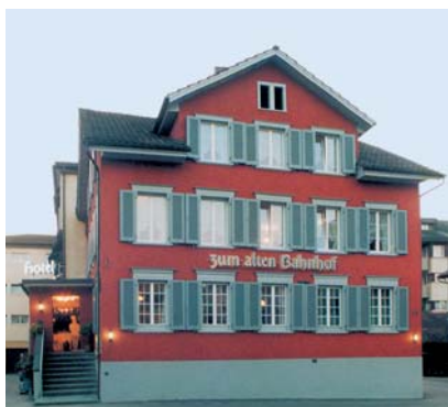
Hotel Zum alten Bahnhof, Gossau Herisauer Strasse 32, 9200 Gossau Tel. 071 388 69 70