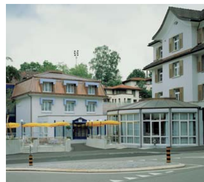
***Hotel Herisau, Herisau Bahnhofstrasse 14, 9100 Herisau Tel. 071 354 83 83